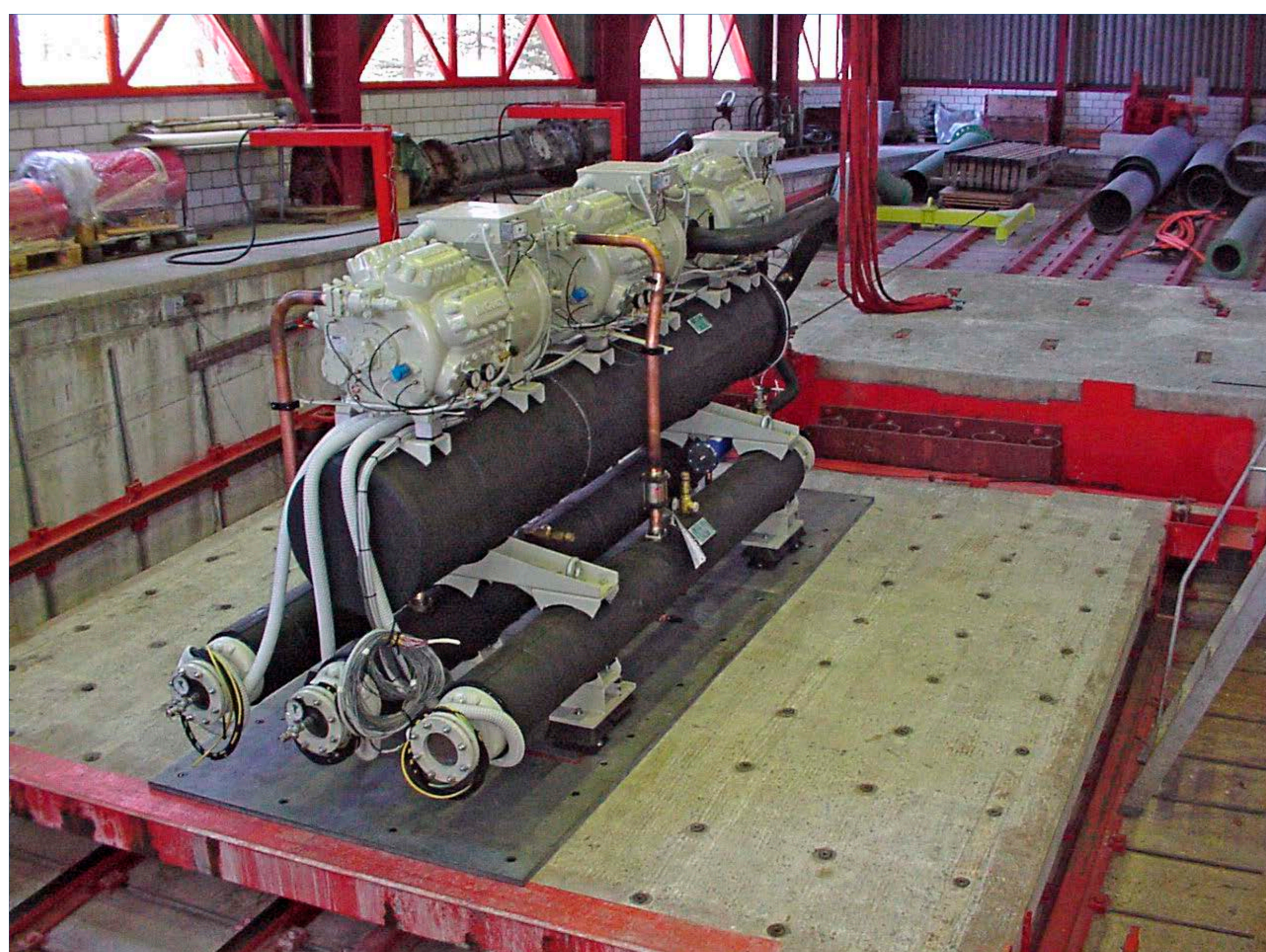
Prüfobjekt (Kältemaschine), Y-Achse