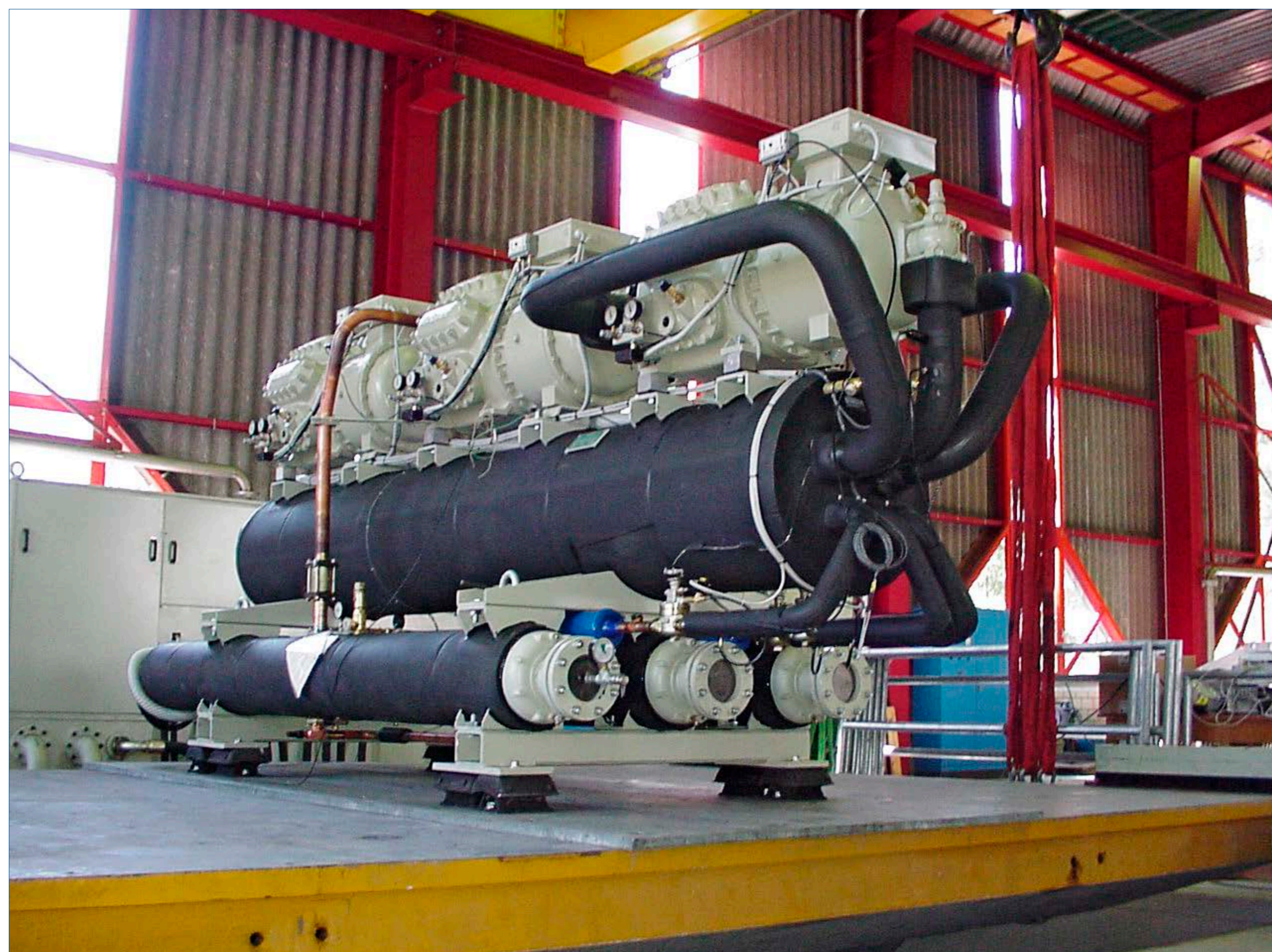
Prüfobjekt (Kältemaschine), X-Achse